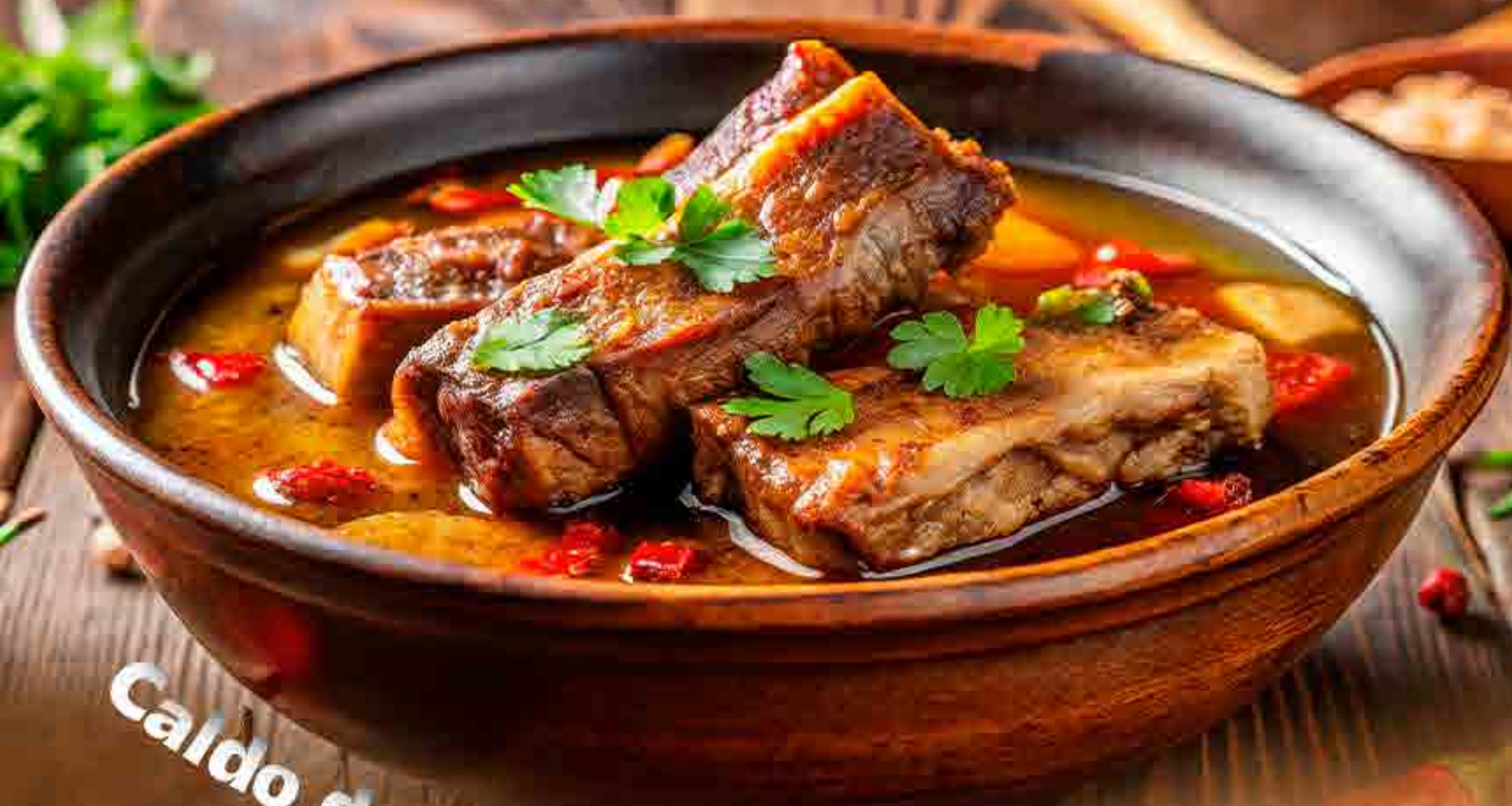
Caldo de Costilla