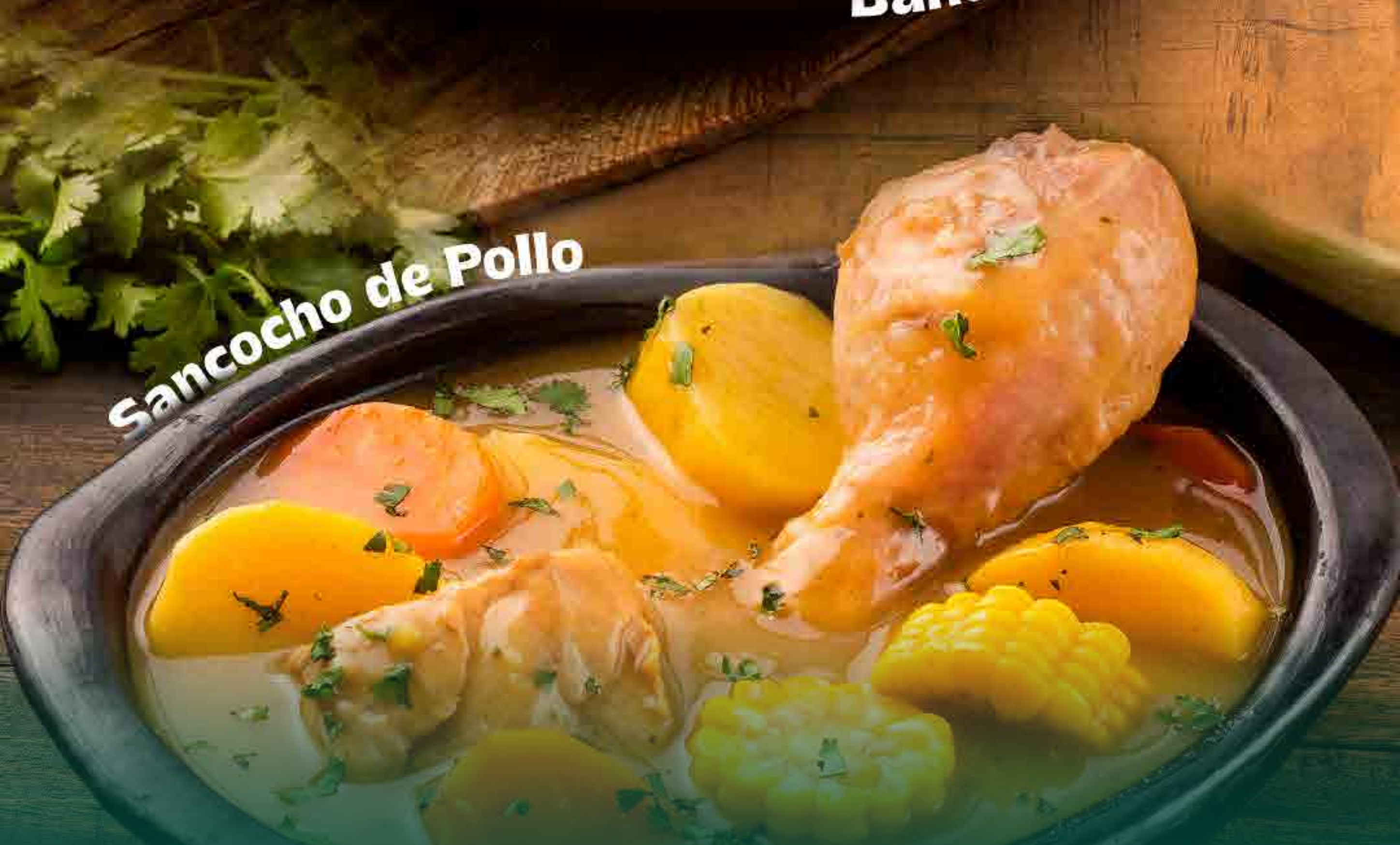
Sancocho de Pollo

Cada plato cuenta una historia y refleja la diversidad cultural de Colombia.