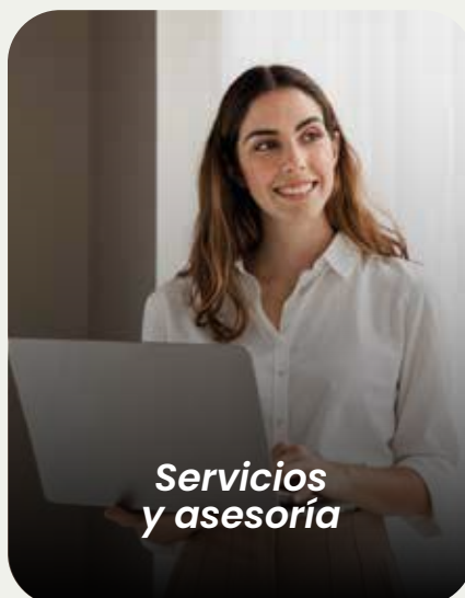
Servicios y asesoría