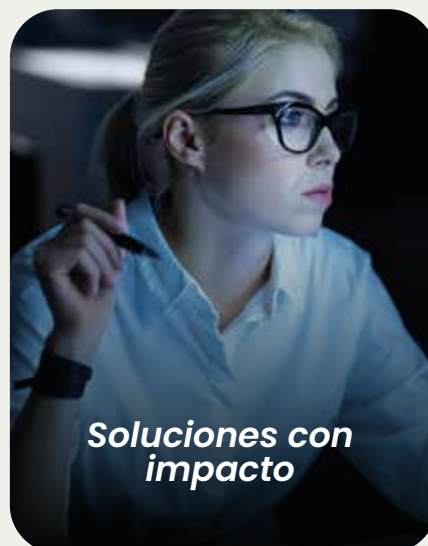
Soluciones con impacto